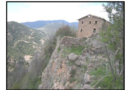
Vue du manoir de Bonner

On a des preuves écrites de l'existence d'un château en Bonner, mais on n'y a pas trouvé des traces, bien qu'on pense, que pour les restes qu'on a trouvé que probablement il s'agit d'une maison fortifiée que dépendait du Château de Fraumir.