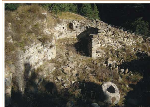
Vista general de la ruina en la se distingue la pila bautismal, hecha de un bloque de piedra vaciado

En las excavaciones entre 1971 y 1977, se retiró todos los restos relacionados con la casa posterior, dejando sólo los restos que corresponden al primitivo monasterio, también se excavó el cementerio que rodeaba la iglesia y del cual todavía se puede ver alguna tumba hecha de losas de piedra.