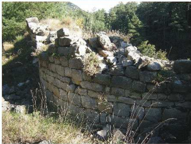
Imagen de la pared de fuera de la iglesia. En el suelo, entre la hierba que se ve en la foto, todavía se puede ver alguna tumba.

Constaba de una iglesia redonda rodeada por varias estancias y una pequeña vivienda. Parece que al monasterio, mientras fue habitado, sólo residía una pequeña comunidad de entre un a diez monjes.