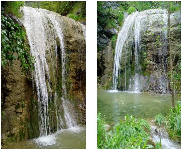
Dos imágenes del salto de agua

Observaciones: El Ayuntamiento de Saldes no se responsabilizan de los accidentes o daños que puedan sufrir los usuarios durante la realización de esta ruta así como tampoco de las deficiencias de señalización que, ocasionalmente, puedan haber. No obstante, en cuanto a posibles deficiencias, agradeceríamos que nos notificaraís las que podáis encontrar. Respetad las propiedades privadas y las vallas de ganado. Avisad, por favor, de cualquier incidencia que encontréis.