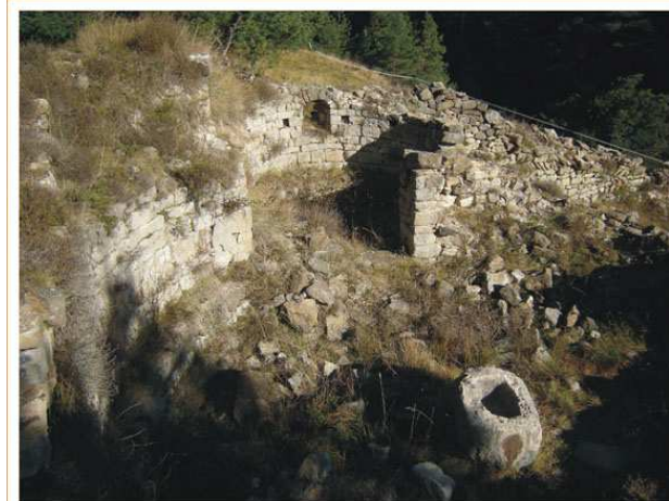
Vue général de la ruine où on se distingue les fonts baptismaux, fait d'un bloque de pierre vidée

Lors des fouilles menées entre 1971 et 1977, on a enlevé tous les restes de la maison postérieure, laissant seulement les restes que correspondent avec le primitive monastère, aussi on fouillait le cimetière que entourait l'église et dont encore on peut voir quelques tombes avec des dalles de pierre.