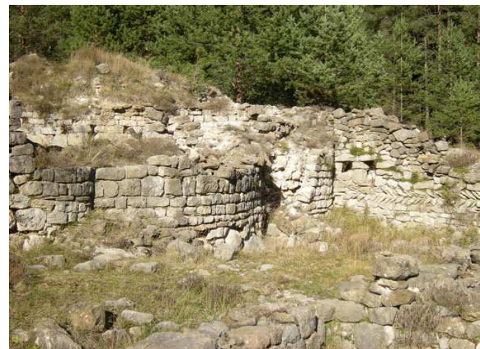
Salle annexe à l'église. Dans le mur on voit deux rangées des dalles inclinées mis en forma d'épi que est un type de construction employé en les constructions romans.