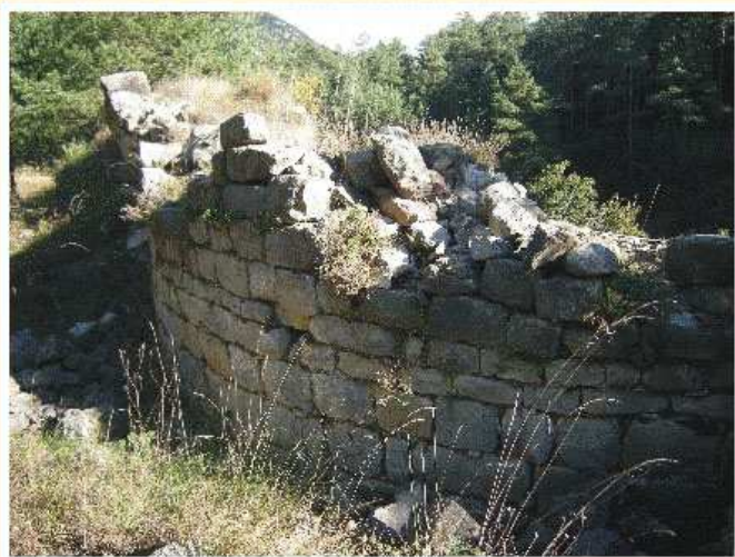
Imatge de la paret de fora de l'església. Al terra, entre l'herba que es veu a la foto, encara es pot veure alguna tomba

Constava d'una església rodona envoltada per diverses estances i un petit habitatge. Sembla que al monestir, mentre va ser habitat, només hi residia una petita comunitat d'entre un a deu monjos.