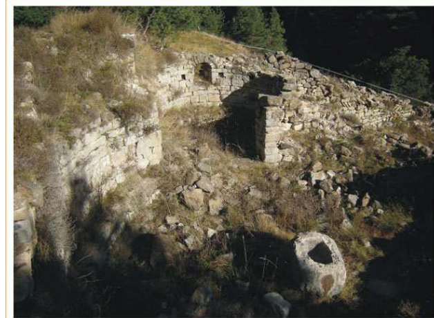
Vista general de les ruïnes on es distingeix la pica baptismal, feta d'un bloc de pedra buidat

primitiu monestir, també es va excavar el cementiri que envoltava l'església i del qual encara es pot veure alguna tomba feta de lloses de pedra.