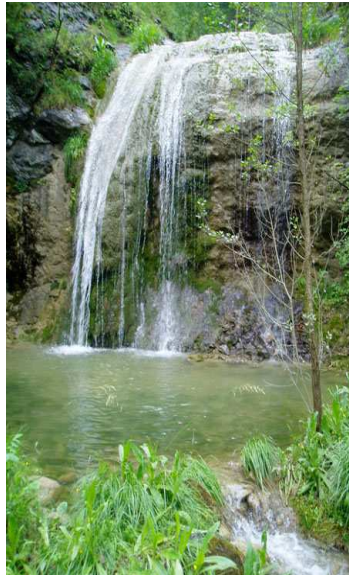
Dues imatges del salt d'aigua